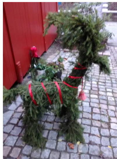
Grane från förra året med ny kostym