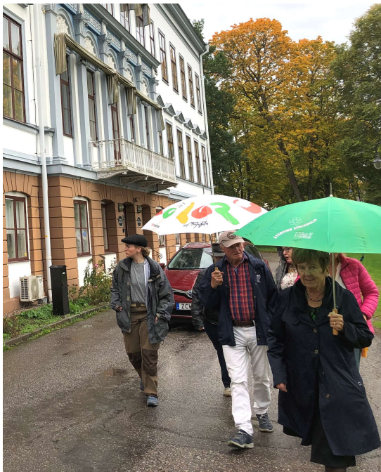
Gysinge Herrgård, den förnämsta av ett 20-tal väl bevarade byggnader inom Gysinge Bruk, uppfördes i mitten av 1800-talet. Innehåller pampiga salar, konferensrum, hotelldel mm