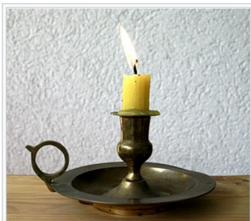
Ljusstake med fingerögla, avsedd att bäras med vid sänggående.