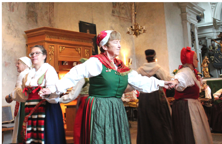
Slängpolska från Spånga