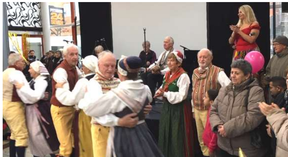
Tensta 50 år