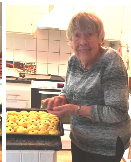
Siw i bullbaket