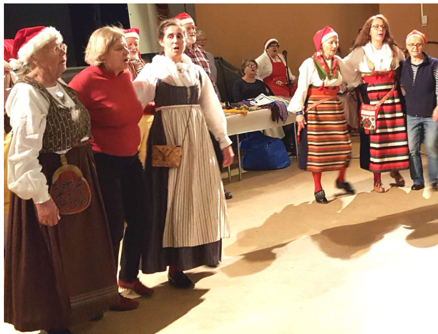
Tre små gummor går två

Under måndagarna före julmarknaden övades danserna inför julmarknaden till musik av Trätakt. Malin komponerade danserna till julmusik och mailade dansbeskrivningar och sångtexter till dem som anmält att de ville delta. Nedan visas några bilder på övningar in i det sista strax före öppnande av marknaden då inte alla hunnit klä om till folkdräkt.