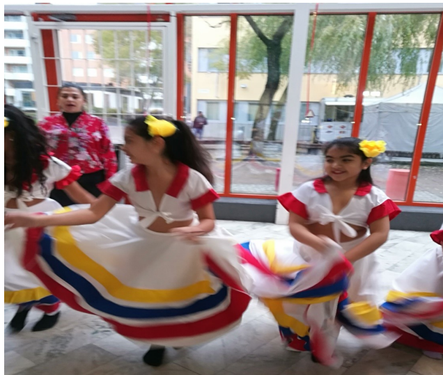
Flickor från en chilensk dansgrupp