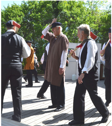
Hejhå, hejhå, vi ut i skogen gå...

Snart fick han chans att presentera Gillet och vår årtidsresa. Skärmarna att gömma sig bakom var förankrade (vinden är nyckfull) och spökrösten förkunnade att "midvinternattens köld är hård". Då är det dags att hugga träd att ha till ved. Även väva vadmalskjolar.