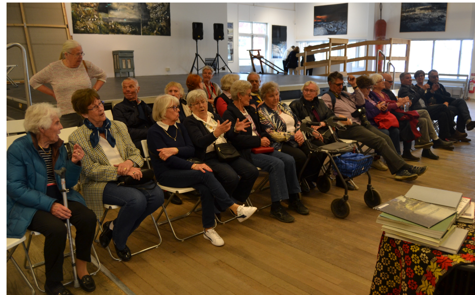
De flesta av deltagarna på Sandgrund