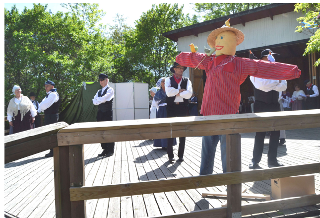
Viljen i veta hur bönderna pläga så havre bakom skrämman