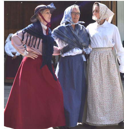
Tre små gummor

Havren ska skäras och linet skördas, rågen malas till mjöl. Men på hösten får man också fara på marknad och utbyta varor. Där finns också "Tre små gummor", Julia med träskor, musikanter och en häftig karusell. En fågelskrämma har följt med årtiderna och bytt från sig själv till sommarskrud, höstskrud och vinterskrud-/julskrud. När vintern kommer får pepparkakorna liv och gör en rolig dans. Julen är här och vi går runt ett enerissnår och stöper ljus, stoppar korb, bakar kakor och kokar julegröt.