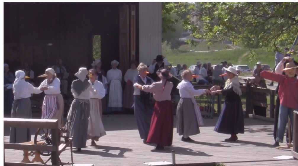
Små fåglarna i skogen de sjunga var dag