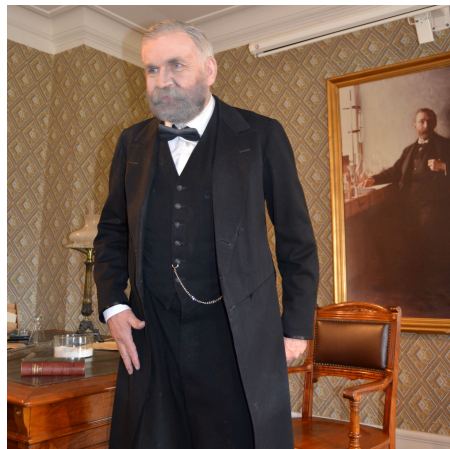
Dockan Alfred reser sig