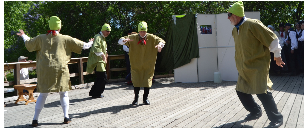
Små grodorna var kanske inte så små