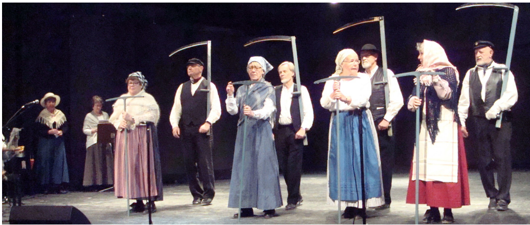
Skördedansen, herrarna flörtar.