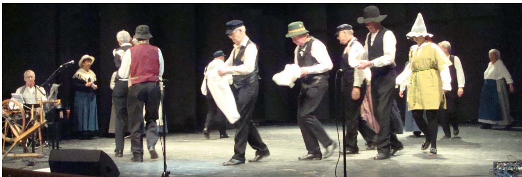
Ett två tre fyr fem och sex och sju. Ut på åkern tåga alla nu. Solen värmer, det är dags att slå. Snart det växer mogna ax på strå. Ett två tre fyr fem och sex och sju. Raskt till kvarnen tåga alla nu. Stenar maler rågen till vårt mjöl. Mor kan sätta deg till dagligt bröd (ny text till Far går först)