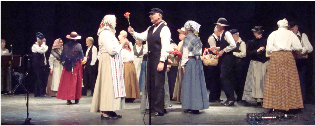
Marknad: Blommor, färsk fisk, kola karameller choklad