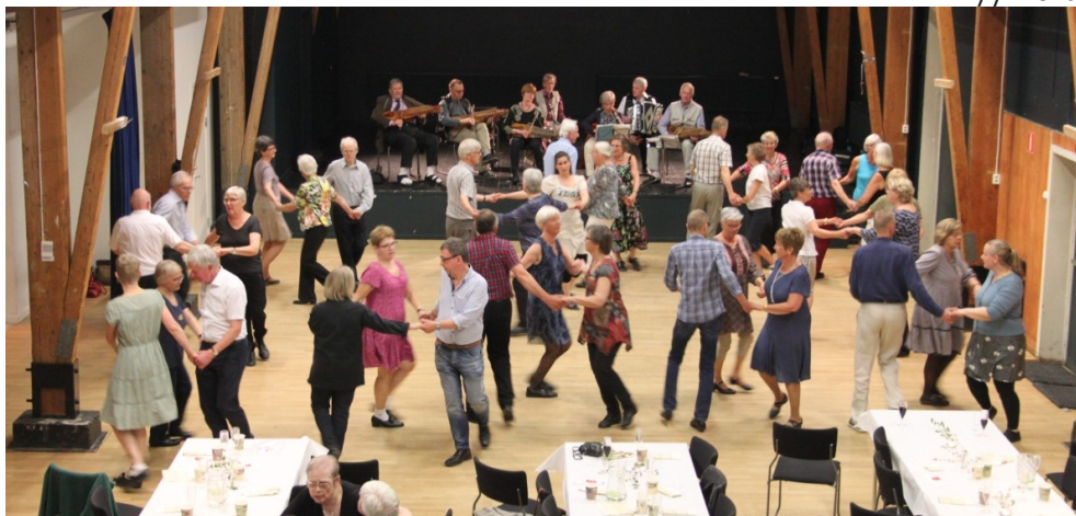
Örebro- och Spångadansare tillsammans på Eggeby Gärd 2017