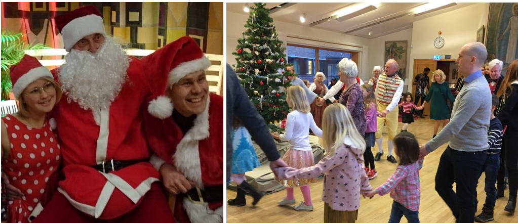
Tomten Bosse och nissarna Astrid och Fredrik Andra omgången