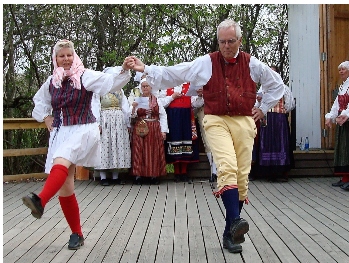
Lill-stinta i kort-kort - en bild från förra årets föreställning Sverigeresan

Ett danslustspel baserat på våra gamla danslekar i symbios med bondepraktikan