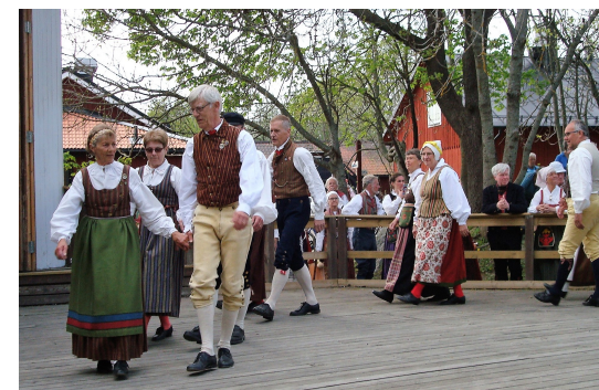
Exempel på Örebroarnas dans på Eggeby Gård

Vi återkommer med mer programinformation senare!