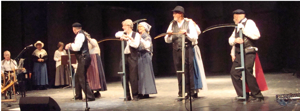
... och damerna flörtar