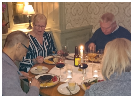
Inte alla fick sitta i kungarummet