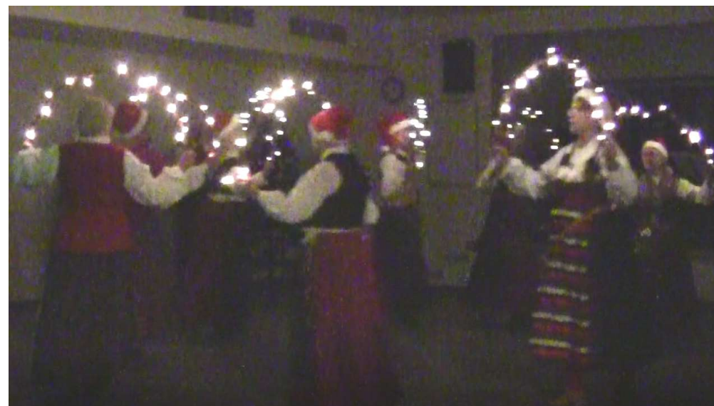
Ljusklädda bågar i Bågdansen