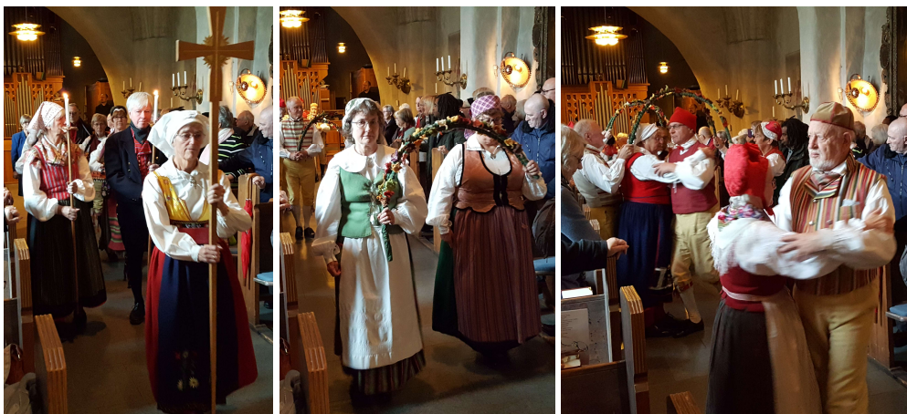
Intåg med korset och ljusen, de blomsterprydda bågarna och dans under bågarna