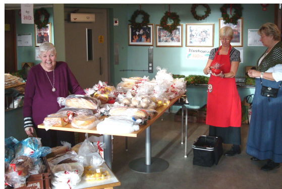
Brödbord i solbelysning

Året julmarknad begav sig den 26 november i ett typiskt novemberväder. På entréplanet var brödborden fulla av hembakade delikatesser. Julkransarna upphängda och förvisades på ett iögonfallande sätt. Loppisborden i stora salen var som vanligt ett dragplåster och drog genast uppmärksamheten till sig. Servering av kaffe med bröd samt smörgåsar var välbesökt och cafépersonalen fick jobba. Många av våra trogna julmarknadsgäster kommer åter år från år och det gynnar oss och vår förening. Roligt också att fylla huset med besökare som slår sig ned i godan ro och pratar och mår bra. Att kunna sprida trivsel och gemyt är en gåva i sig.