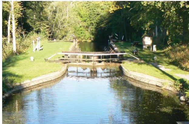
Glöm inte Kinda kanal