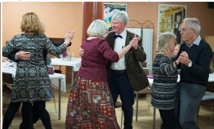
Styrdans a la folkdansgille