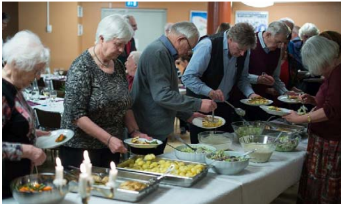
Kyckling med svampsås och grönsaker