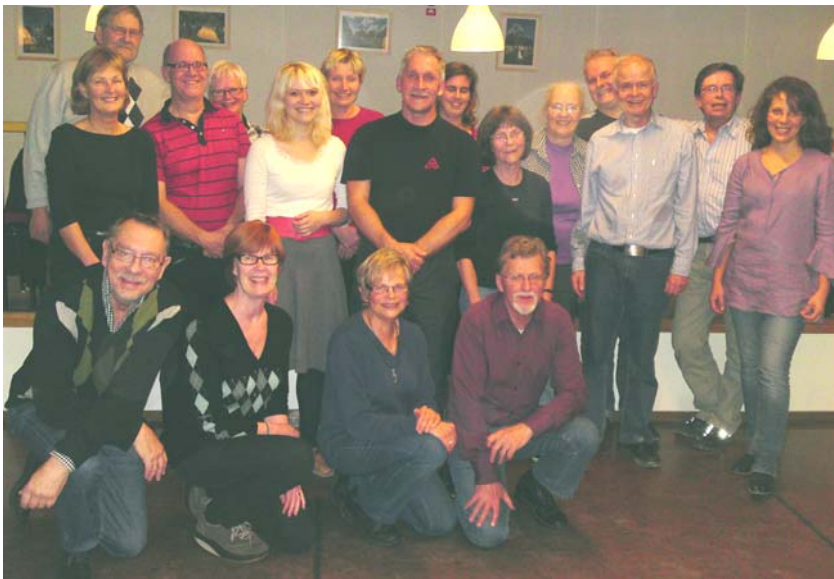
Delagarna på grundkursen tillsammans med Trätakt och dansledarna