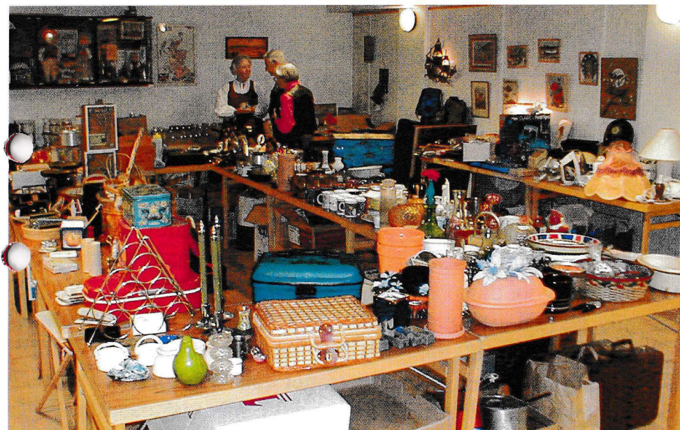
Lugnet före stormen.