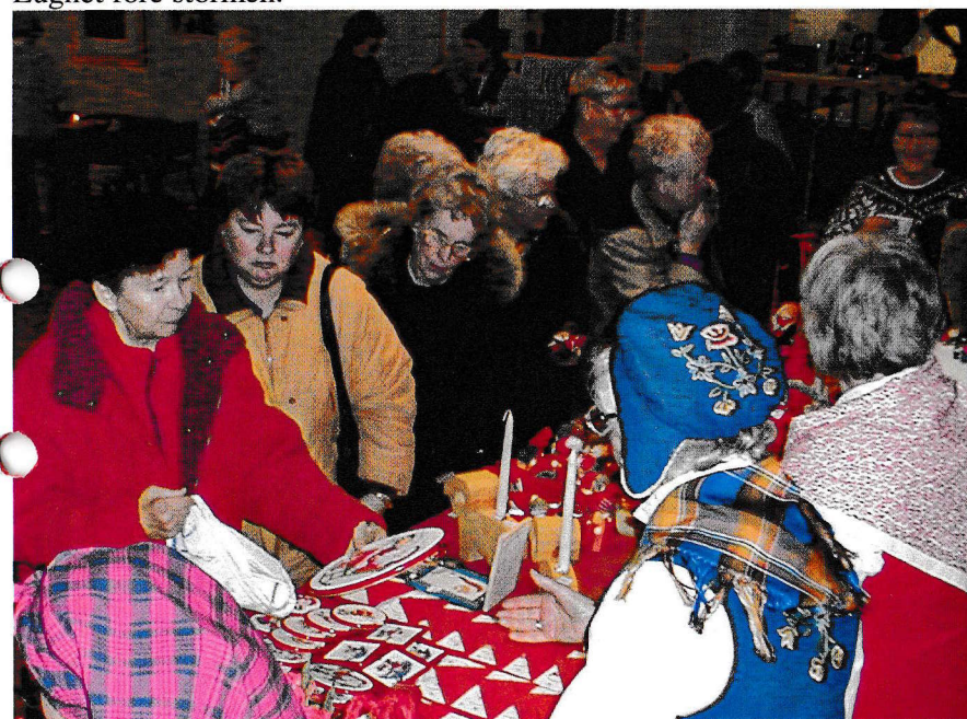
Kommers i full gång.