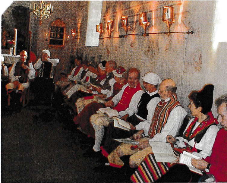
Vilket nummer har nästa psalm?