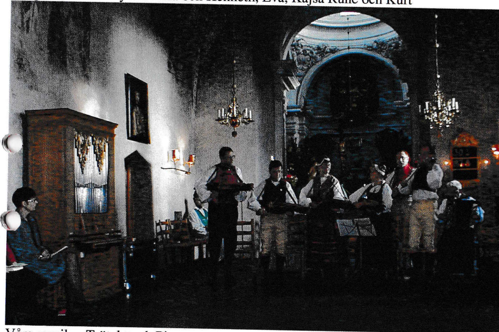
Våra musiker Trätakt och Pixtorparn.